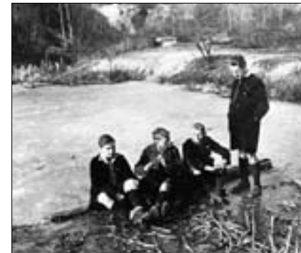
Oben: Flötenkonzert auf dem zugefrorenen Weiher bei Weiherhof 1928